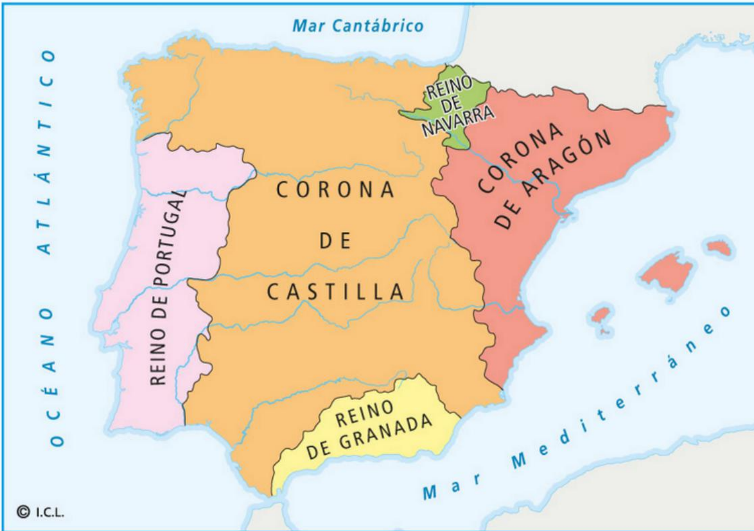
La Península en el siglo XIV.