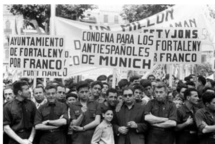
Contubernio de Munich-1962

El Partido Socialista Obrero Español (PSOE), con menor presencia en los movimientos sociales, estuvo condicionado por el enfrentamiento entre la dirección en el exilio y la militancia del interior. En el Congreso de Suresnes (Francia), celebrado en 1972, estos últimos se hicieron con el control del partido bajo la dirección de Felipe González .