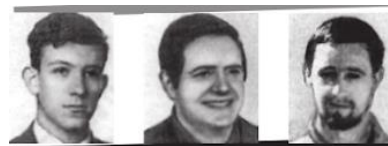
Los seis condenados a muerte que fueron indultados.

En lo referente a la represión, se funda el TOP – tribunal de Orden Público-, encargado de reprimir las conductas que bajo ese régimen dictatorial eran consideradas delitos políticos, y la Brigada Político-Social, una policía secreta. Se llevan a cabo una serie de procesos de los que cabe destacar el Proceso de Burgos en 1970 (ETA) de tal repercusión mediática que logró el indulto de los procesados y, el Proceso 1001 a Comisiones Obreras que acabó con toda la cúpula del sindicato en la cárcel.