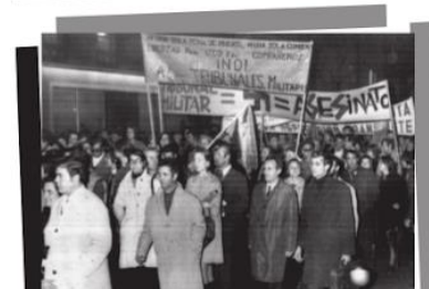
Proceso de Burgos-1970

Para este momento, se comenzaba a vislumbrar la paulatina caída del régimen, que adelantaba la futura crisis. Esto se acentuó con escándalos de corrupción como el caso MATESA 2 .