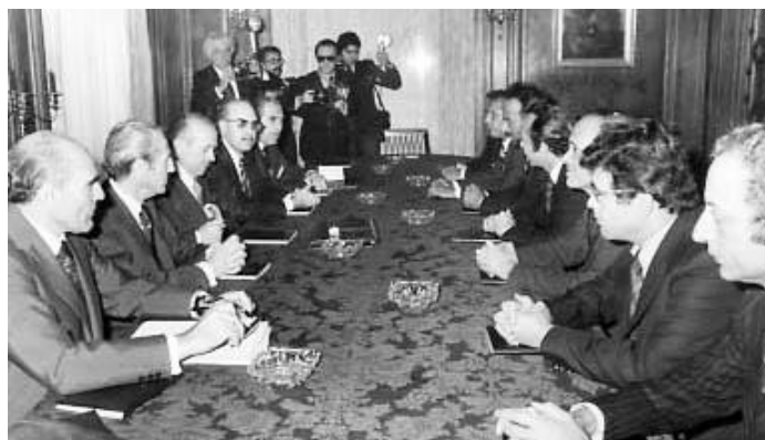
Acuerdos de Madrid-1975