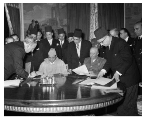
Descolonización de Marruecos-1956-69(1975)