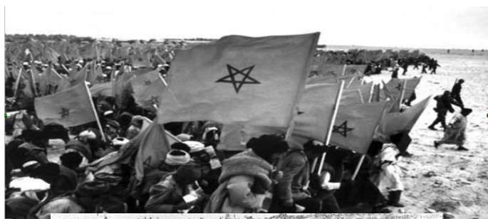
Marcha verde, Marruecos-1975

Para proceder a la descolonización del territorio del Sahara (v.s. descolonización de Marruecos), el gobierno español había aceptado celebrar un referéndum de autodeterminación de ese territorio, a propuesta de la ONU y del Frente Polisario , una formación independentista saharauí. En 1975, aprovechando la grave enfermedad de Franco, Marruecos exigió la entrega de ese territorio, rico en fosfatos y pesca, y el rey Hassan II organizó la Marcha Verde , una invasión pacífica del Sahara que movilizó a decenas de miles de civiles. Ante el peligro de un conflicto bélico con Marruecos y con Franco agonizando, el gobierno de Arias Navarro claudicó y el 14 de noviembre se firmaron los Acuerdos de Madrid , lo que suponía la entrega de este territorio a Marruecos y Mauritania.