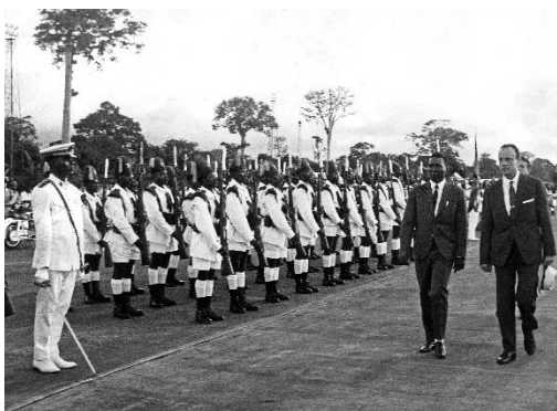
Descolonización de Guinea Ecuatorial-1968

En 1970 se firma el acuerdo preferencial con la CEE.