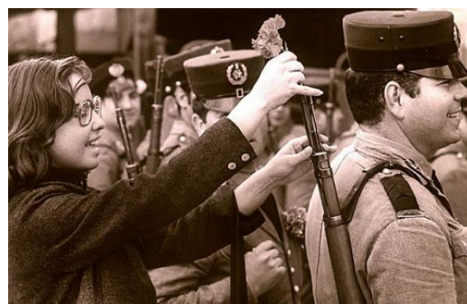
Revolución de los Claveles en Portugal-1974

Además, en 1974 tenía lugar la caída de los últimos regímenes dictatoriales, por lo que España se convertía en la última dictadura europea. Por lo tanto, se puso fin en Grecia a la “dictadura de los Coroneles”, y en Portugal se puso fin a la “dictadura salazarista” mediante la “revolución de los claveles”.