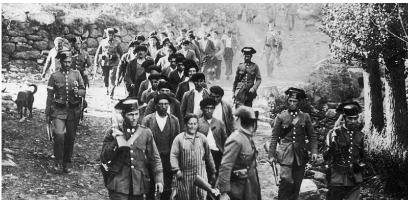
Represión de los sublevados en Asturias en el 34

El balance de muertos, heridos y detenidos fue muy alto: hubo un total de más de 2000 muertos, y más de 30 000 obreros encarcelados. Se encarcela también a Largo Caballero, e incluso a Manuel Azaña que, pese no haber participado, es igualmente acusado (v.s.). En consecuencia, la revolución resultó un fracaso que solo contribuyó a añadir tensión al escenario político.