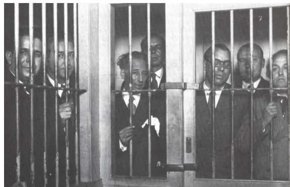
Encarcelamiento del gobierno de la Generalitat