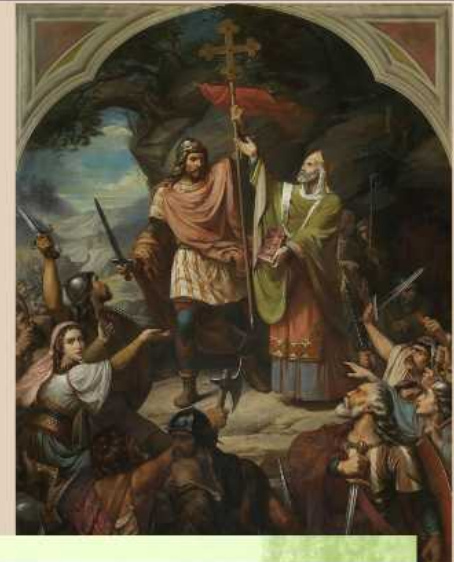
EXPANSIÓN DEL REINO DE ASTURIAS (SS. VIII-X)