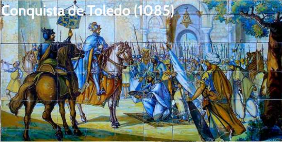
Conquista de Toledo (1085)