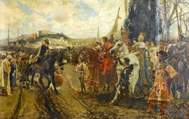
Rendición de Granada (2 enero 1492)