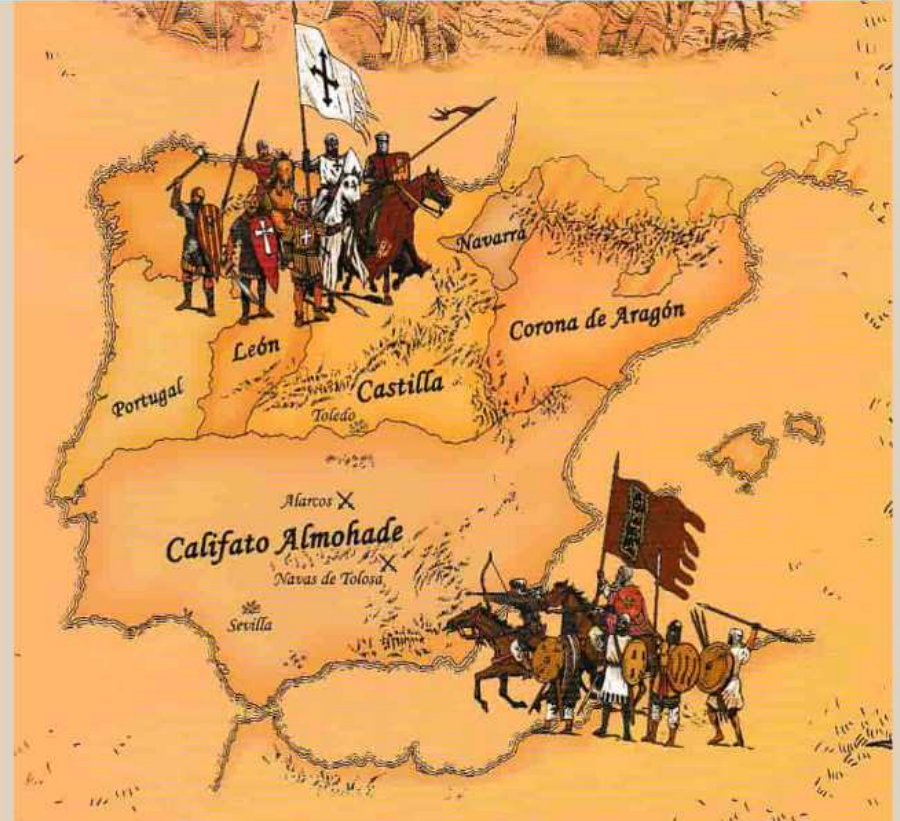
Batalla de las Navas de Tolosa (1212)