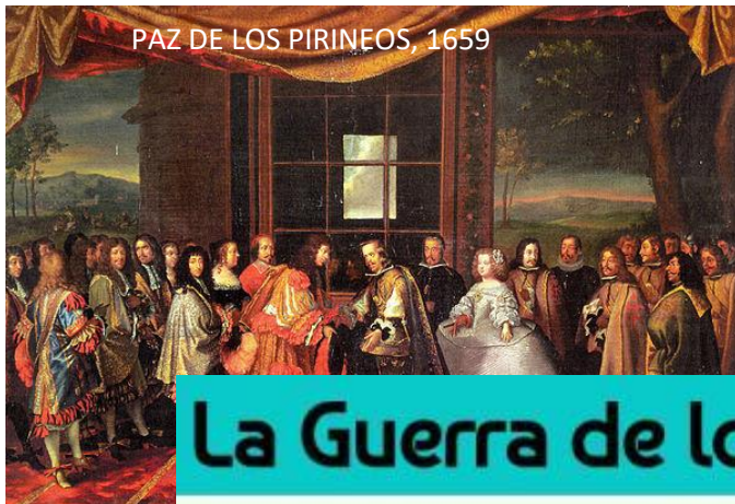
PAZ DE LOS PIRINEOS, 1659