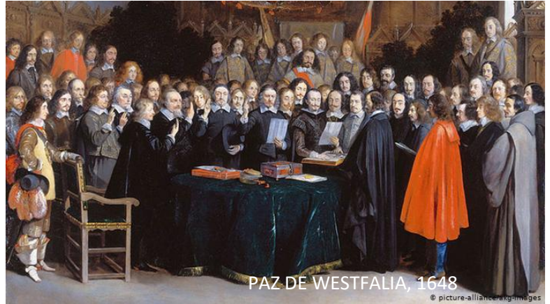
PAZ DE WESTFALIA, 1648