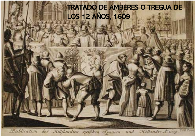
TRATADO DE AMBERES O TREGUA DE LOS 12 AÑOS, 1609

orden. El tratado se selló con el matrimonio entre Luis XIV y María Teresa de Austria (por el que, años más tarde, su nieto, Felipe de Anjou, aspirará al trono español).