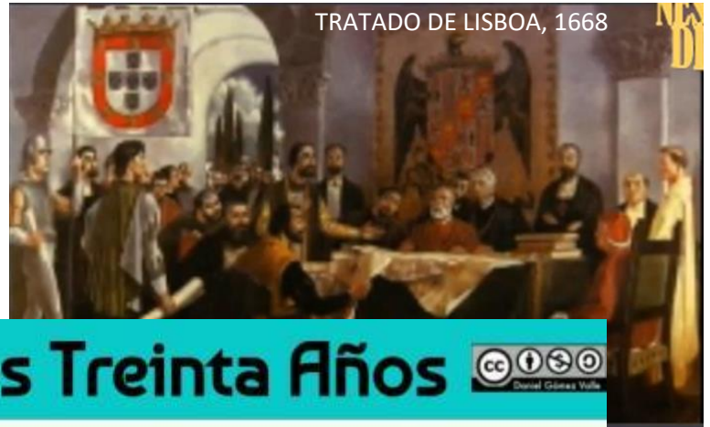
TRATADO DE LISBOA, 1668