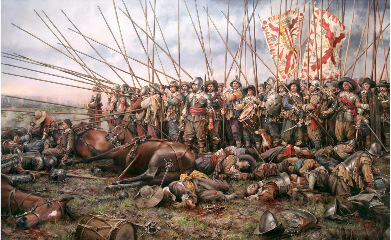
ROCROI, 1643 (Rocroi, el último tercio”, Augusto Ferrer-Dalmau,2011)